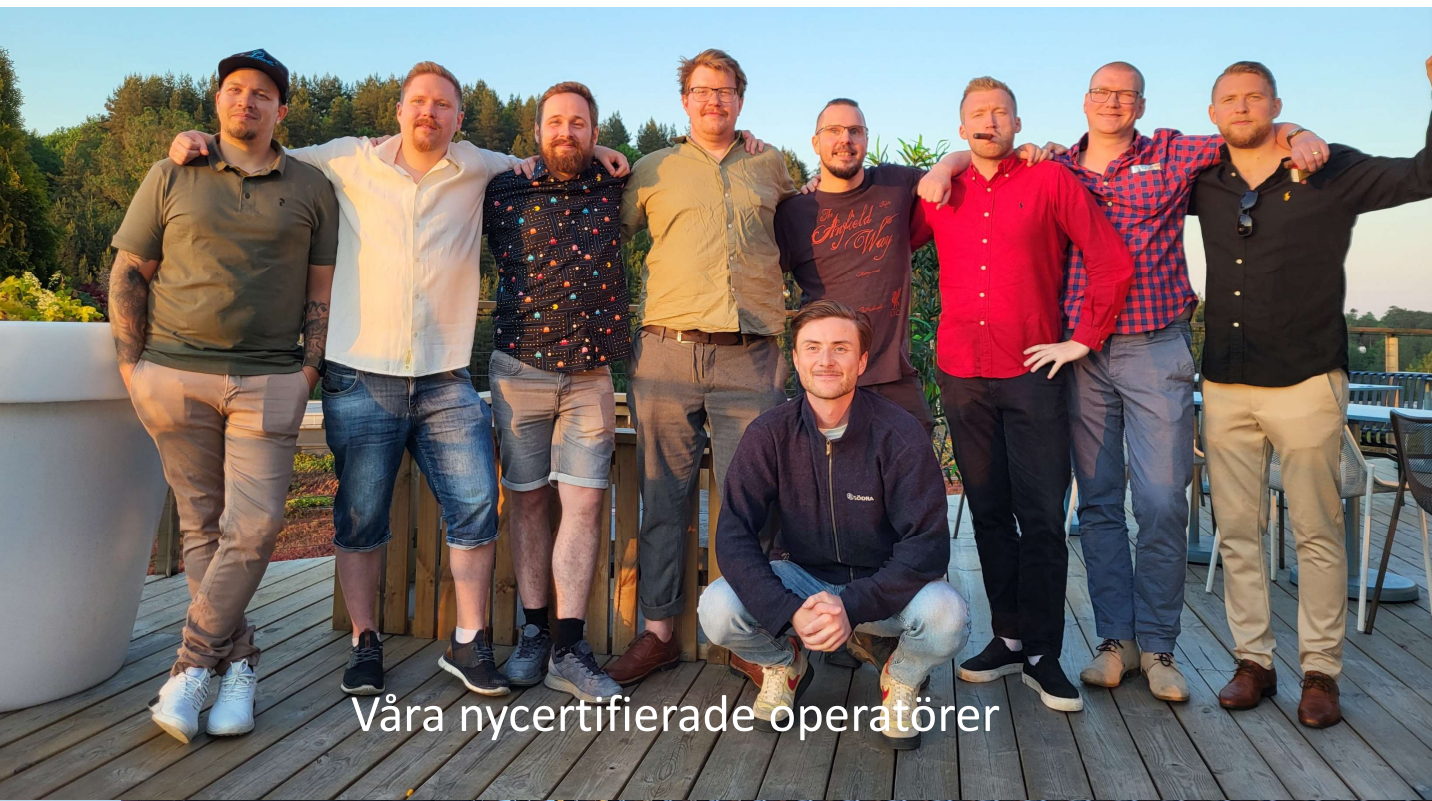
Våra nycertifierade operatörer

Middag med diplomutdelning till våra nycertifierade operatörer