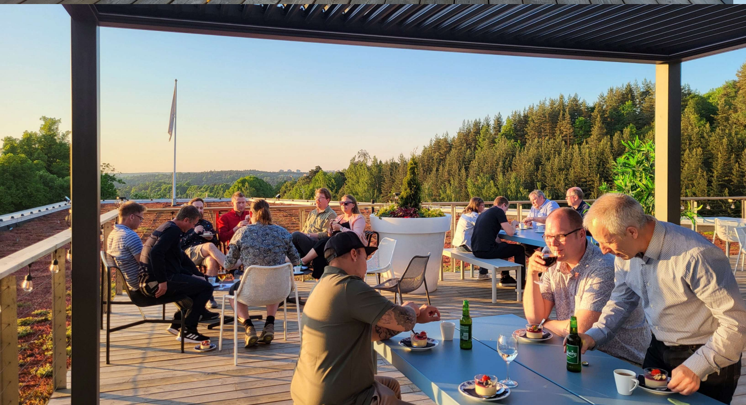
Ett av många tal

Middag med diplomutdelning till våra nycertifierade operatörer